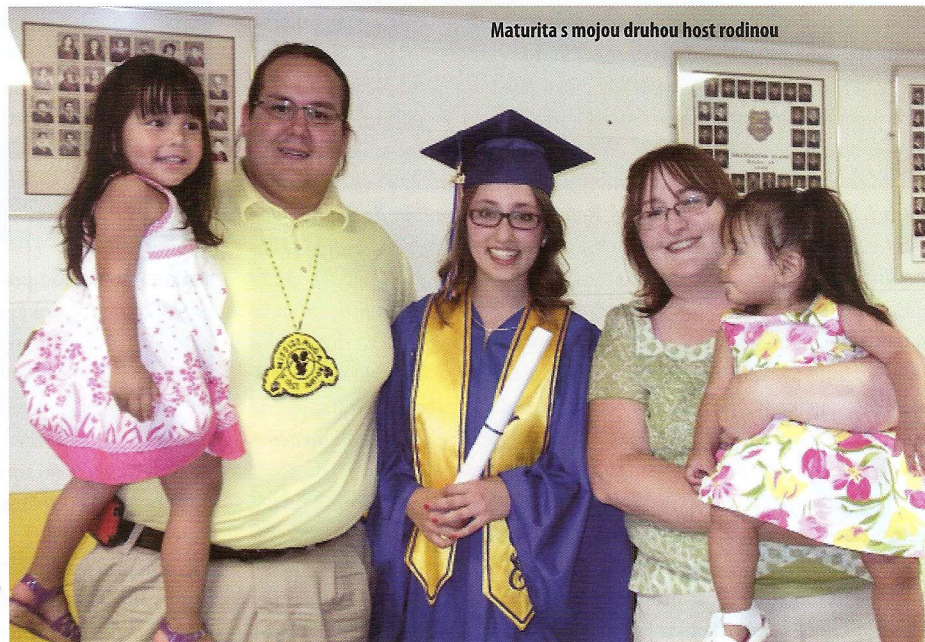
Maturita s mojou druhou host-rodinou

Kanadské Vianoce boli veľmi podobné tým z amerických filmov. Bola som veľmi vďačná mojej host-rodine, že sa ma snažili udržať veselú a uľahčiť mi tú situáciu, tú najťažšiu časť roka. V škole sme pred Vianocami mali vianočný ples s témou masky, kde sa každý nahodil do šiat. Nazvala by som to takou diskotékou v gala a s benátskymi maskami na tvárach. Tam som nacvičila so skupinkou