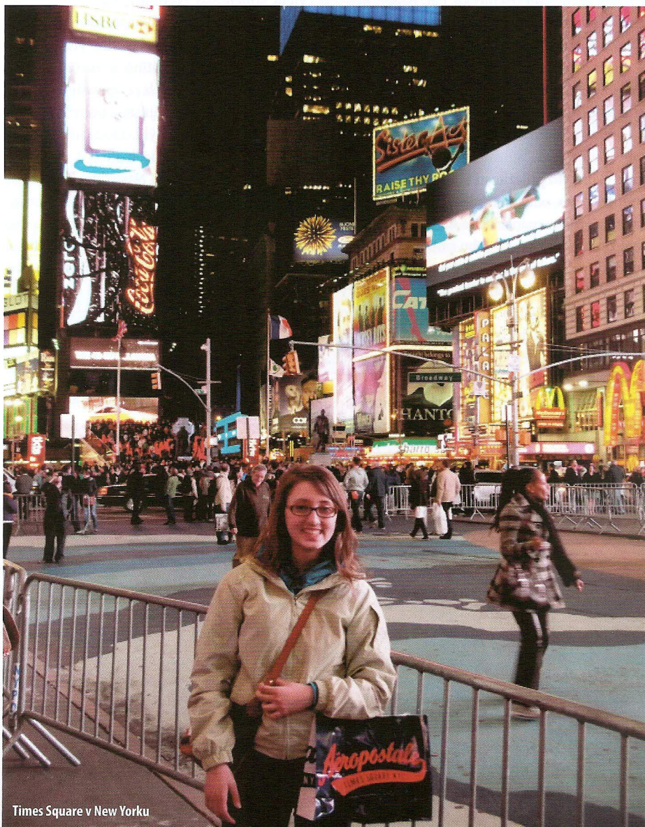
Times Square v New Yorku

Pôvodná reportáž pre RGN / text: Natália Kianičková, absolventka programu YSE 2010/2011, vyslaná RC Žilina